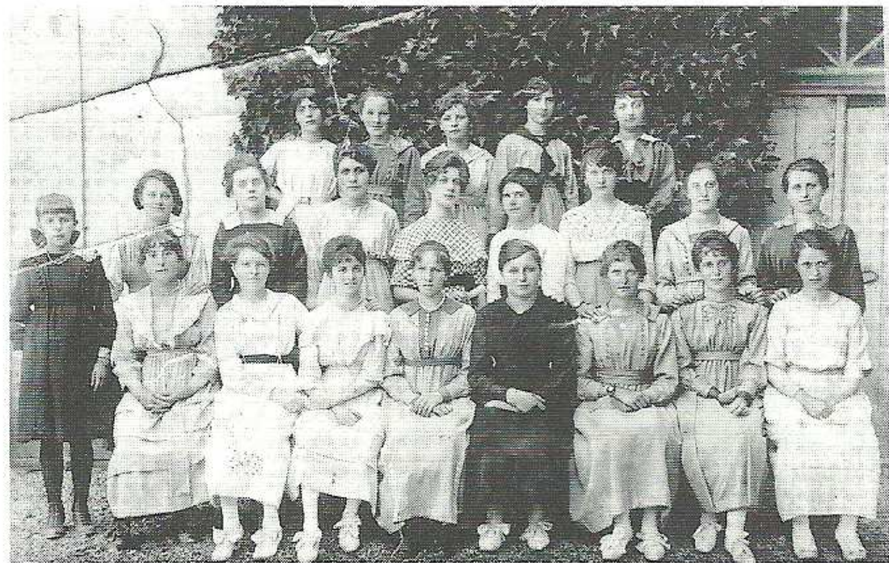
Toutes ces jeunes filles photographiées le 15/08/1919 habitent Fleurey et sont décédées. Madame Simone Perrusson-Gangniau nous a confié cette archive. Les lecteurs y retrouveront peut-être une des leurs ou repèreront des similitudes de visage.