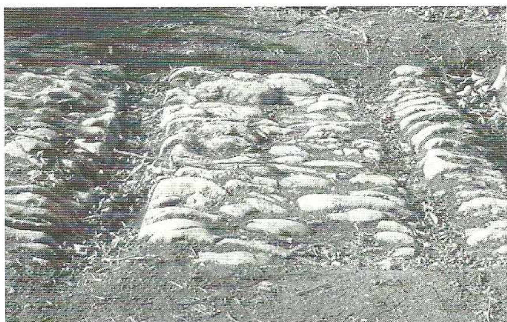
Vestige de voie romaine visible entre Sombornon et Alésia. Remarquer l'usure considérable des pavés à l'emplacement du passage des roues

Les recherches sur cet itinéraire gallo-romain n'ont jamais été approfondies, cependant des traces de pavages caractéristiques ont été repérées près de la ferme de la Colombière et aussi à l'emplacement de l'actuelle zone artisanale. Passant près de la ferme précitée, le tracé de la voie pouvait obliquer sur Morcueil, puis remonter la combe pour arriver à Mâlain.