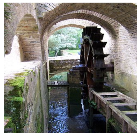
Forges de Buffon Canal d'amenée et roue à aubes

Une centaine de personnes, de Fleurey, de Dijon, et de tous les villages environnants, se sont déplacés pour cette soirée conviviale qui s'est prolongée, autour du conférencier, par un verre de l'amitié.