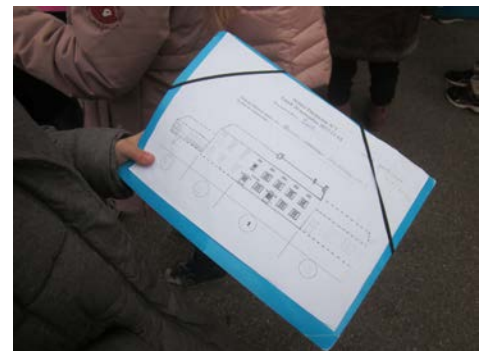
Comprendre l'architecture de l'école en dessinant