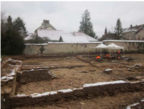
En arrière-plan, à gauche, la façade ouest de l'église du prieuré