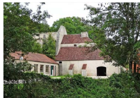
Haut-fourneau Ampilly-le-Sec