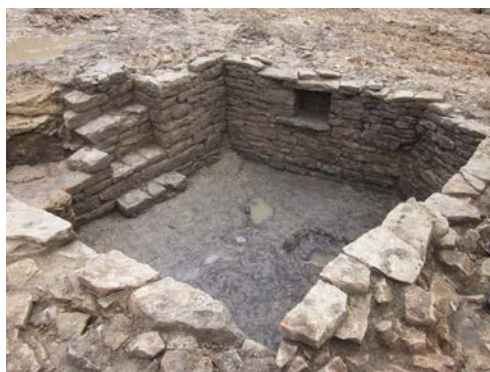
Une cave dégagée (XIII e siècle ?)

L'Institut national de recherches archéologiques préventives (Inrap) vient de réaliser une fouille archéologique à Fleurey-sur-Ouche, sur prescription de l'État (DRAC Bourgogne-Franche-Comté).