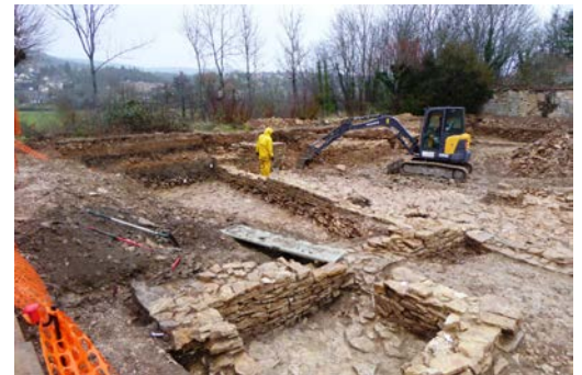
Mise en évidence de fondations de bâtiments du Moyen Âge

Les archéologues ont mis au jour de nombreux vestiges, notamment des trous de poteaux, des fondations de murs, des caves et deux sépultures d'enfants... Les tessons de céramique récoltés permettent d'ores-et-déjà de confirmer l'occupation du site au moins depuis le X e siècle. Il s'agit maintenant de tenter de comprendre les différentes phases d'occupation des lieux et leur organisation, ce qui permettra d'enrichir notre connaissance de ce quartier médiéval proche de l'église du prieuré.