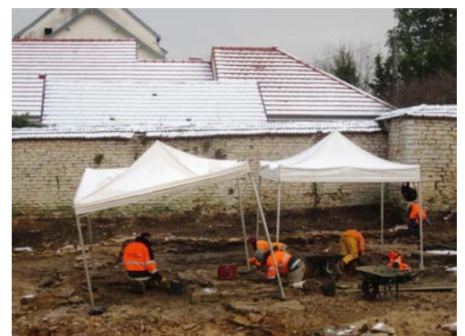
Mise au jour d'une cave