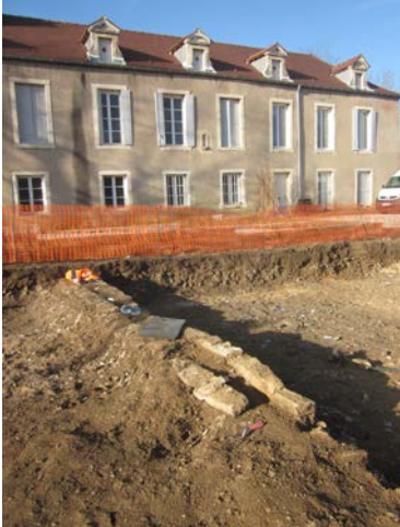
Les Charmilles, un aménagement probable pour conduire l'eau à une fontaine (jardins du XVII e siècle ?)