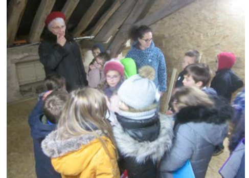
Découverte du grenier de l'école et de sa charpente

Fidèles à nos objectifs de sauvegarde et de transmission des divers patrimoines légués par nos ancêtres, l'association vient d'établir un partenariat pédagogique avec une classe de l'école élémentaire autour d'un projet mêlant histoire et patrimoine du village. Commencé en 2017 avec l'étude de l'évolution du bâtiment de l'école et celle de son architecture, le travail se prolongera en 2018 avec la découverte de l'ancien lavoir, celle de l'église, sans oublier la lecture, autour du village, des paysages façonnés par l'homme, le climat et la géologie. En toute fin d'année, une séance supplémentaire de choix s'est glissée dans notre programme, avec une visite sur le chantier des fouilles qui se sont déroulées dernièrement aux Charmilles. Une chance extraordinaire pour des élèves que de pouvoir découvrir les archéologues au travail sur le terrain !