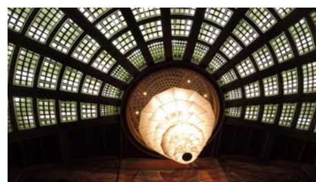
La coupole de l'hémicycle et le lustre monumental