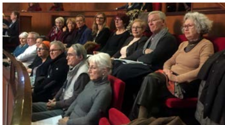
Le groupe dans l'hémicycle