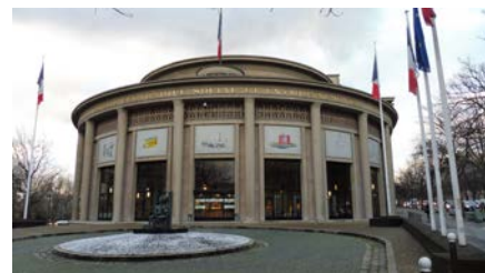
La rotonde du Palais d'Iéna-1937