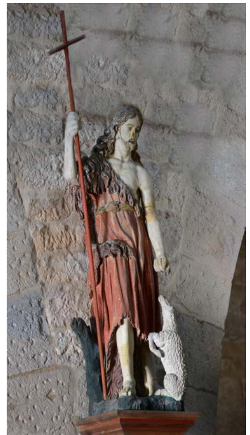
Saint Jean-Baptiste XVII e siècle

À leur arrivée, il a fallu concevoir, au pied levé, une visite pour jeune enfant. Notre saint Jean-Baptiste est fort heureusement accompagné d'un petit agneau que nous avons appris à reconnaître partout dans l'édifice : dans la statuaire, sur les tableaux, dans les vitraux et même sur une statuette de bâton de procession. Il y avait aussi ce triptyque qui s'ouvre et se ferme comme un grand livre, sans compter ce joli manteau cousu pour Notre-Dame d'Étang et les pampilles des lustres qui étincellent à la lumière. Malgré le temps maussade, la visite du village et celle de l'église auront eu leurs sourires et des visiteurs... de qualité !