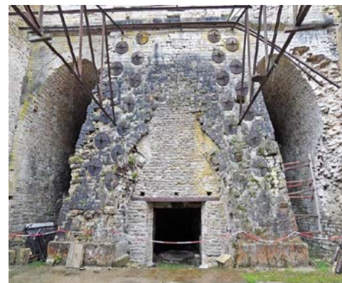
Ancien haut-fourneau De Val Suzon

De nombreuses mines furent exploitées pour alimenter ces hauts-fourneaux, en fer et en charbon. Les plus anciennes mines de fer sont encore visibles à Fontenay, mais nous avons également découvert en images celles moins connues de Gissey-sur-Ouche, de Thoste ou de Nolay-Change. En 1856, la société Thoureau s'est intéressée à la couche d'oolithe ferrugineuse qui affleure en de nombreuses zones du territoire de Fleurey-sur-Ouche, dont celle du mont Cocheron, où le minerai est présent sur toute sa périphérie. Toutefois, ce projet d'exploitation n'a jamais été concrétisé. (Cf. Borbeteil n° 31.)