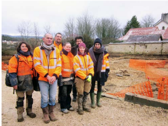
L'équipe des archéologues de l'Inrap sur le chantier de fouilles