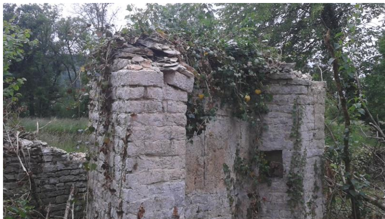
Etat en 2015

Deux grandes pierres constituent le mur du fond, à la hauteur des niches précédentes : exposées au