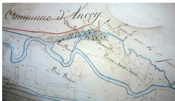
Cadastre napoléonien, 1812