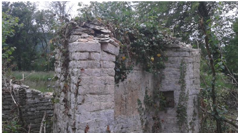
Etat en 2015