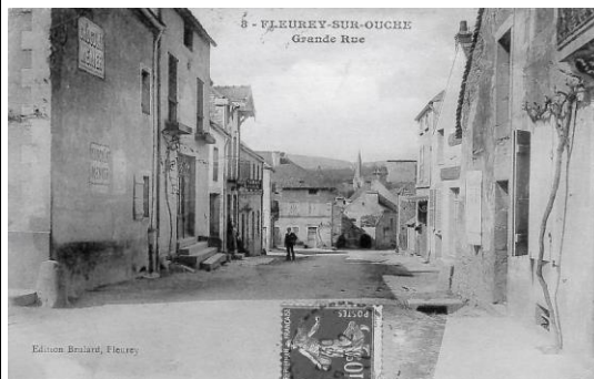
Carte postale – 1911 - « tabac régie » à gauche

En 1920 et 23, il existe une carte postale avec régie tabac en dessous de la fleuriste