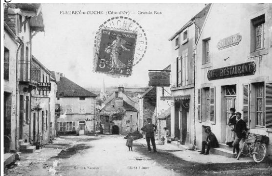
Carte postal – 1911 - « tabac régie » à gauche