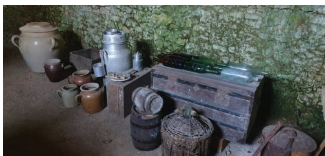
Récipients pour conservation de la viande, du lait et du vin autrefois