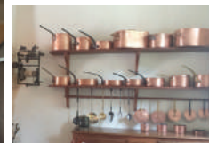
Aile Sarcus salle à manger et cuisine