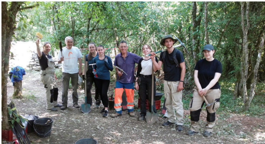
L'équipe de bénévoles, 16 juin 2023