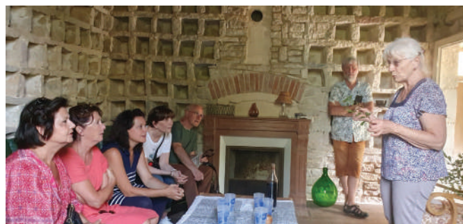
Dégustation de Kneu à l'intérieur d'un pigeonnier