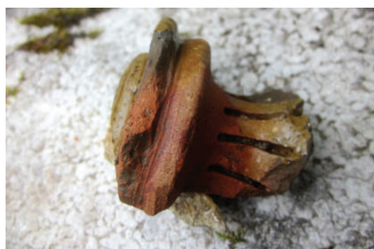
Un tesson de céramique bien mystérieux