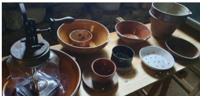
Ustensiles alimentaires pour la fabrication du beurre et du fromage