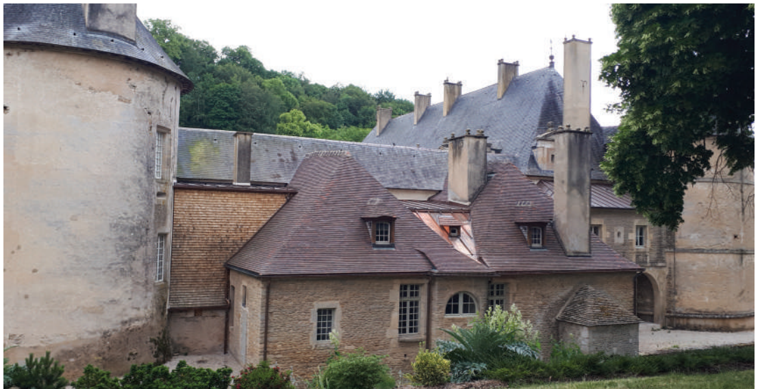
Vue extérieure de l'aile Sarcus

L'aile Sarcus, du nom du propriétaire du XIX e siècle qui acheta le château en 1825 et le sauva de la ruine, a été ouverte pour la première fois au public en avril dernier après quatre années de travaux de restauration. Elle permet au visiteur de découvrir les intérieurs d'une maison noble du XIX e siècle meublés et décorés de la manière la plus authentique possible par le Centre des Monuments Nationaux.