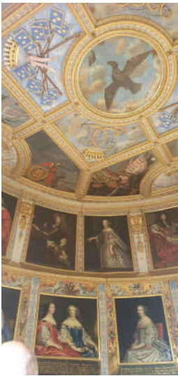
Une des galeries de portraits