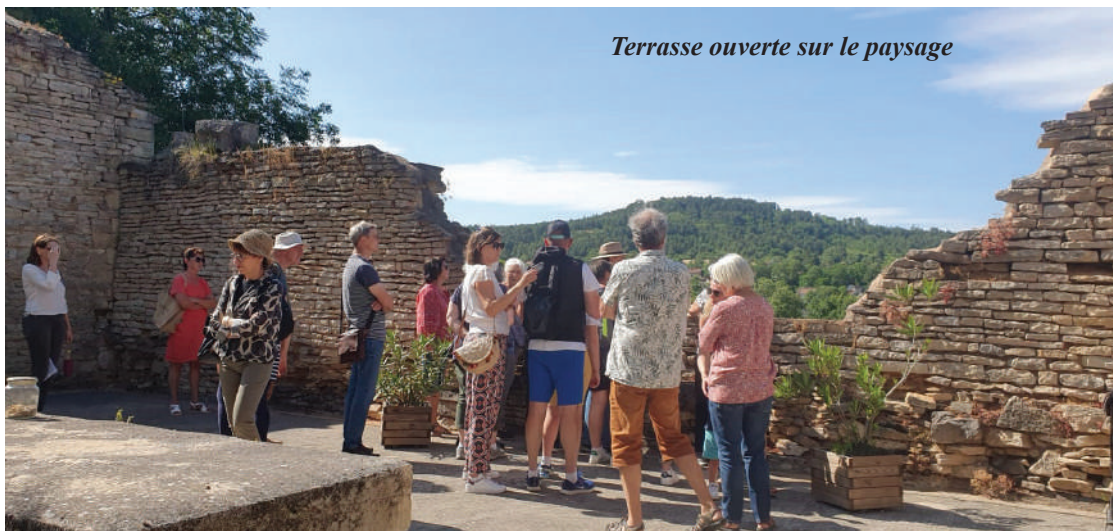
Terrasse ouverte sur le paysage

Inspirés par le livre Fleurey Gourmand , La CCOM et HIPAF ont proposé une visite de notre village qui était, il n'y a pas si longtemps, essentiellement à vocation agricole.