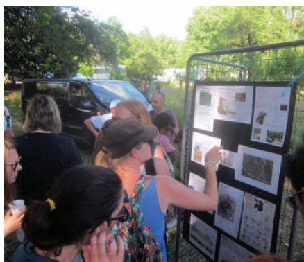
Rallye du patrimoine pour le conseil municipal d'enfants ; à l'arrivée chacun s'empresse de vérifier ses réponses