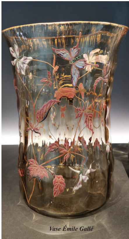
Vase Émile Gallé

La visite s'est ensuite poursuivie au Centre International d'Art Verrier et Musée du Verre et du Cristal de Meisenthal .